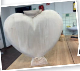
Dritter Tag: Schleifen, schleifen und wochmals schleifen