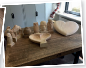
In VHS-Kurs gefertigte Objekte