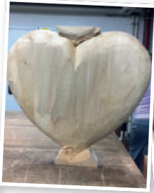
Erster und zweiter Tag: Bearbeitung