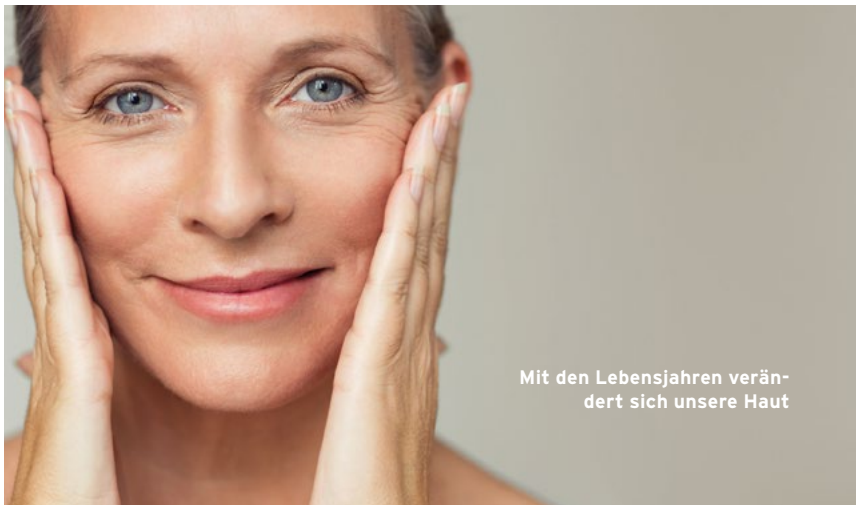
Mit den Lebensjahren verändert sich unsere Haut

Heute fühlen sich Frauen einfach länger jung. Doch oft verrät das Gesicht ihr wahres Alter. Geeignete Hautpflege kann die Haut länger prall und jugendlich wirken lassen.